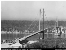
(b) Takoma Narrows Bridge, Washington (1940)