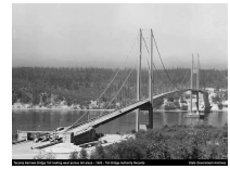
(b) Takoma Narrows Bridge, Washington (1940)